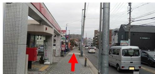
③ 左手に郵便局を見ながら直進