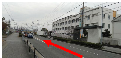
① 千種台中正門前を直進