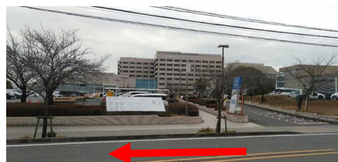
② 愛知県がんセンター前を通り