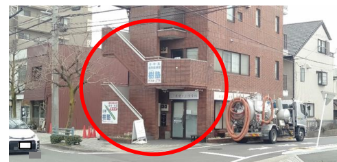
④ 右手側に教室があります。 (2 階が教室です。)